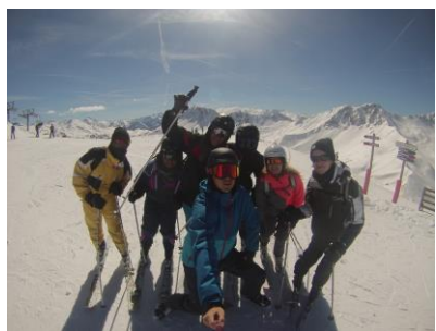
Le groupe 1

Après les études (à noter que les élèves sont à l'heure et travaillent 1,5 heure, habitude qu'il ne faudra surtout ne pas perdre au retour...), ce sera l'heure du repas italien : pizza en entrée, spaghetti bolognaise en plat et flan au caramel en dessert. De quoi reconstituer les forces pour demain.