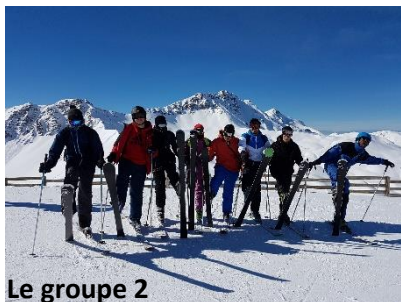
Le groupe 2

Pour rappel, les groupes sont modifiés tous les jours en fonction des progrès ou des difficultés de chacun et les enseignants changent eux même de groupe pour que les élèves voient des façons parfois différentes d'aborder l'activité.