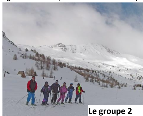
Le groupe 2