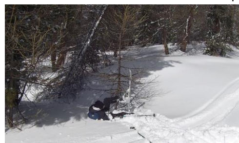
Nos élèves aiment la nature et les arbres, développement durable oblige

Comme hier le retour au chalet s'est fait tranquillement, le gouter étant le bienvenue. Étude du soir en vérifiant que personne ne s'endort à la suite des efforts de la journée puis repas du