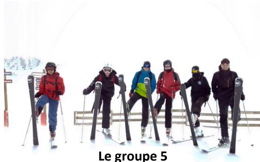
Le groupe 5

L'après-midi de ski a été bien studieuse et les élèves progressent bien.