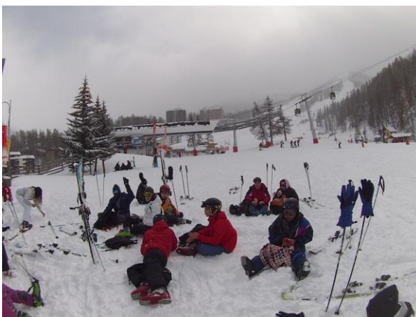
Le repas de midi